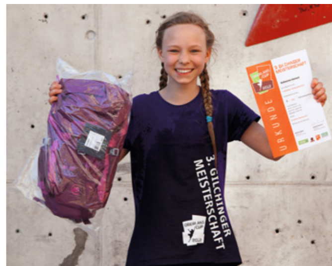
Siegerfreuden auf der 3. Gilchinger Meisterschaft