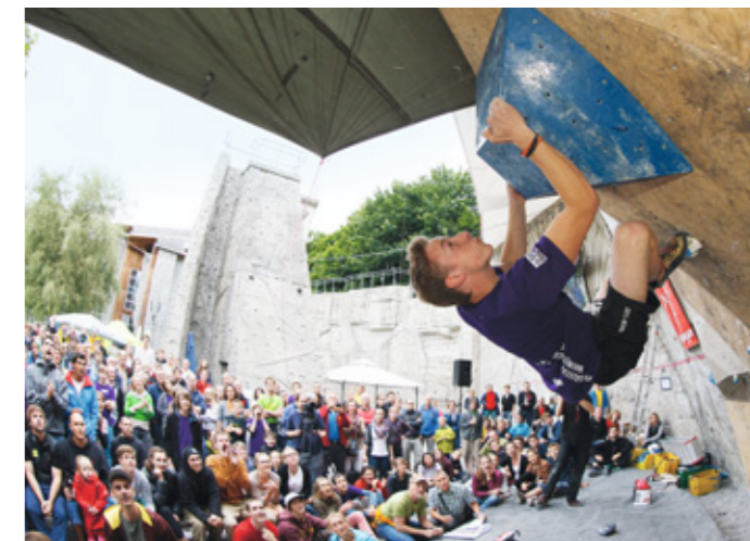
Akrobatische Kletterkünste auf der Münchner Jubiläums-Stadtmeisterschaft